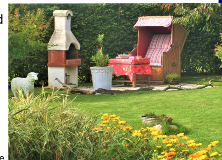
Ferienwohnung Seestern (Maisonette 35 m²) mit eigener Gartenterrasse

Das sonnige Schlafzimmer mit romantischem, 160x200cm großen Himmelbett und weitem Blick auf Felder und Deich hat neben Sitzgruppe und Schrankwand Kabel-TV, Internetstereo, CD/DVD und WLAN. Pantryküche und Essbereich befinden sich wie das Tageslichtbad (Dusche, WC, Waschtisch, Spiegel, Fön) eine Ebene tiefer und bieten eine schöne Sicht auf Garten und Umgebung.